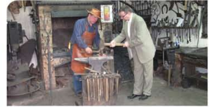
Szlak żelaza i kowalskich tradycji w Wojciechowie