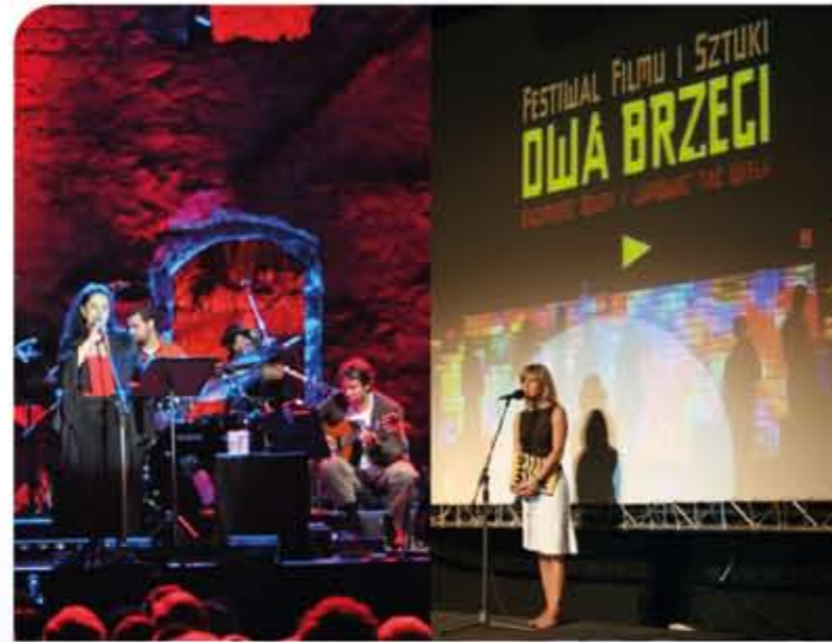
Festiwal Filmowy „Dwa Brzegi” w Kazimierzu Dolnym