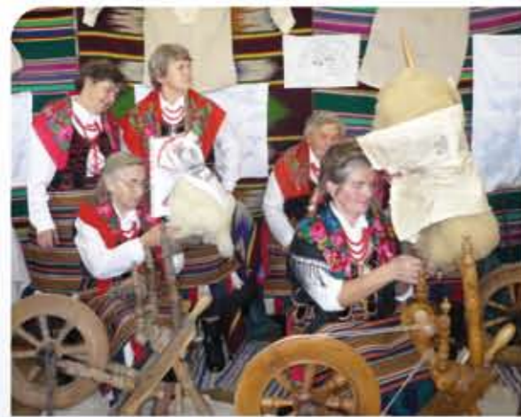
Impreza kulturalna „Dziedzictwo Ojców” w Żyrzynie