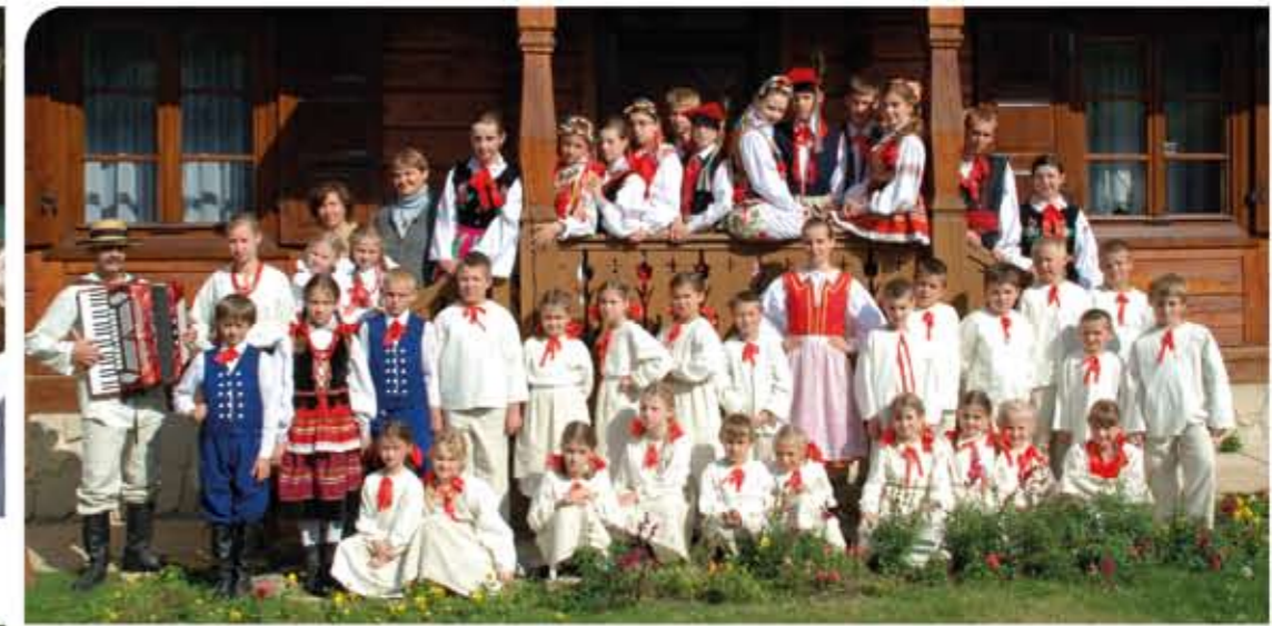
Zespół Tańca Ludowego „Bystrzacy” z Wąwolnicy